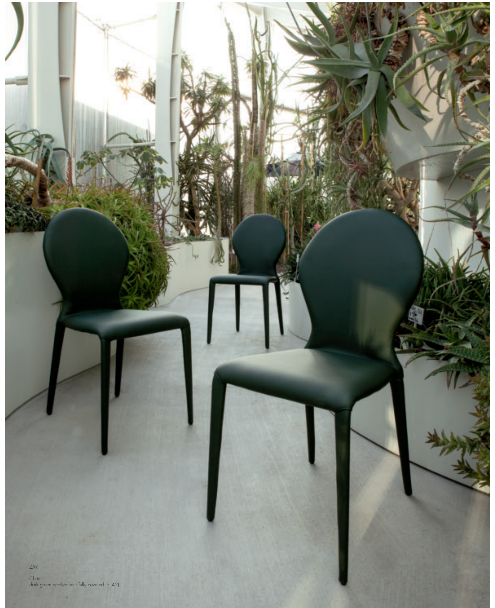
ZAR Chair: dark green eco-leather - fully covered (S_42).