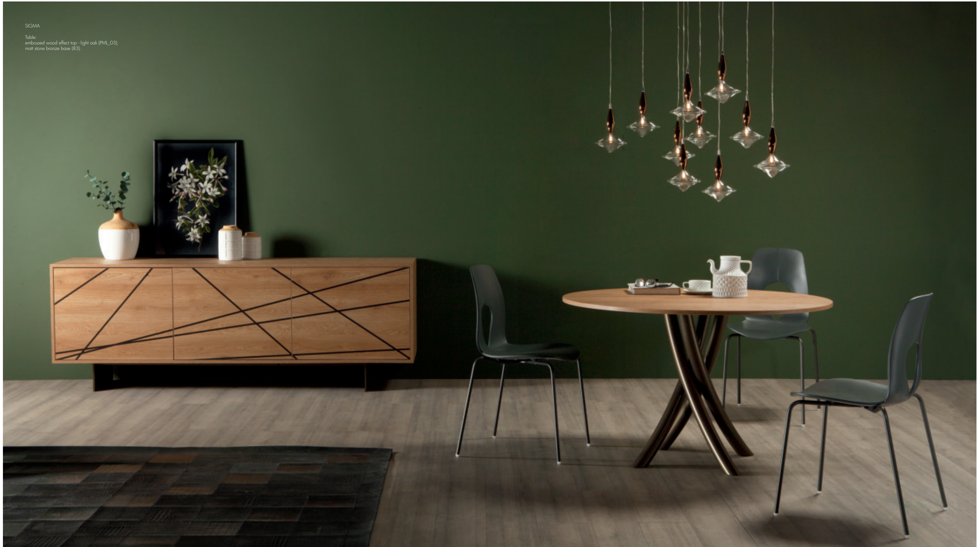
Table: embossed wood effect top - light oak (PML_03); matt stone bronze base (83).