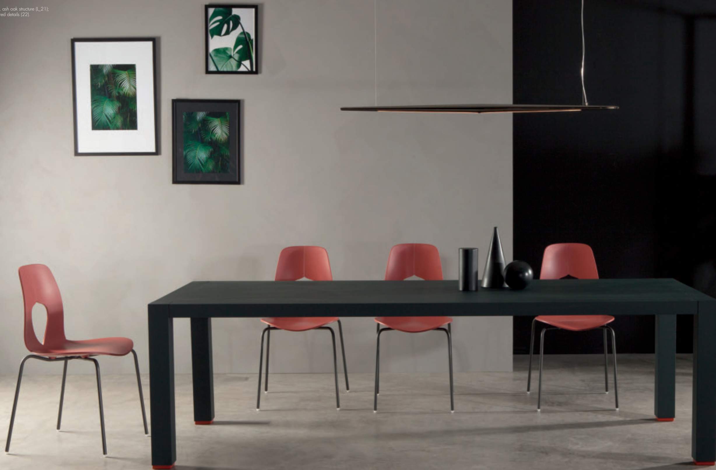
Table: open pore, ash oak structure (L_21); matt brick red details (22).