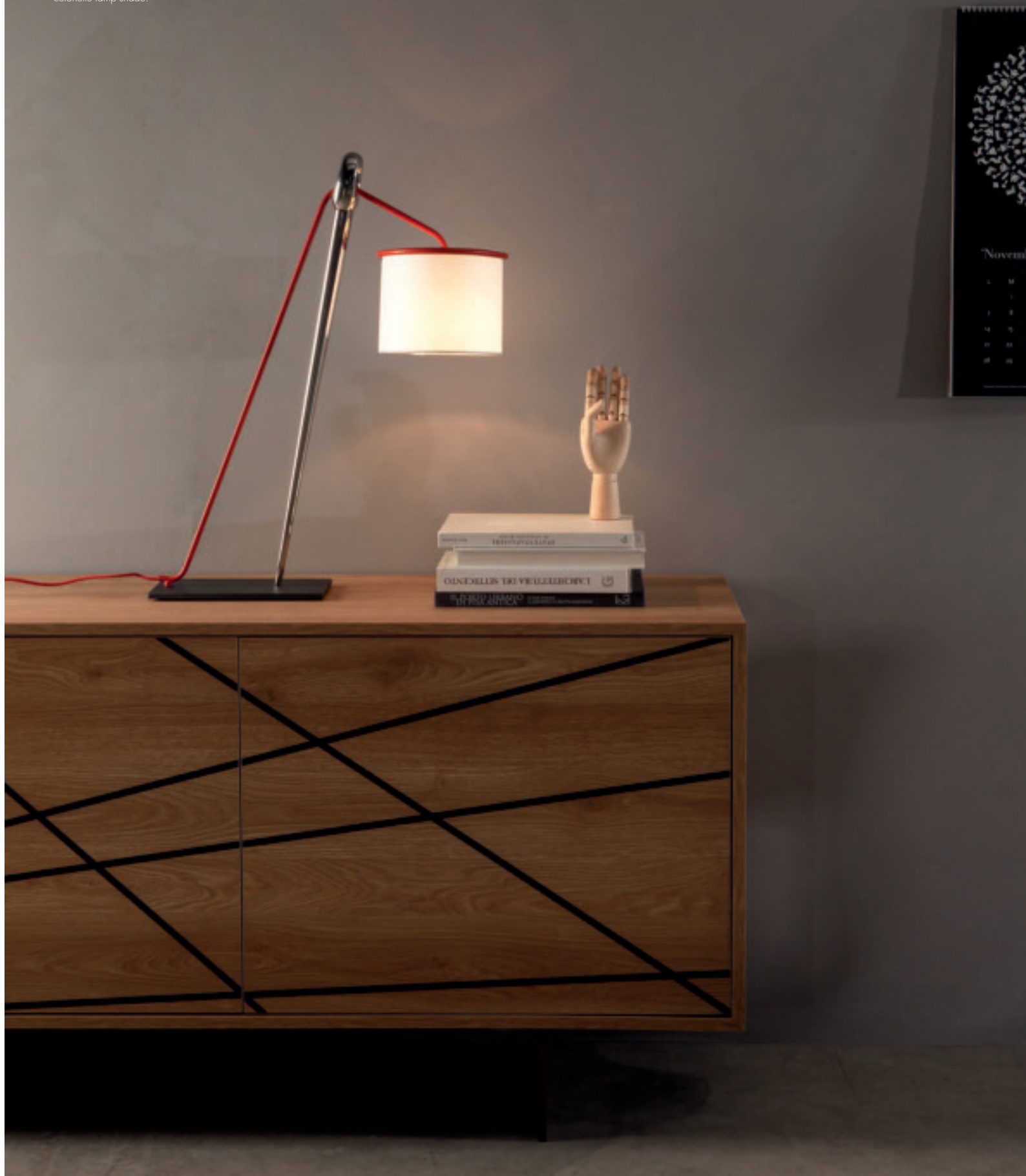
Table lamp: chrome version; red cable; cotonette lamp shade.

Luce, come il sole, come la luna che si riflette su di un lago. Osserva. Libero. Light like sunshine, like the moon reflecting on a lake. See. Free.