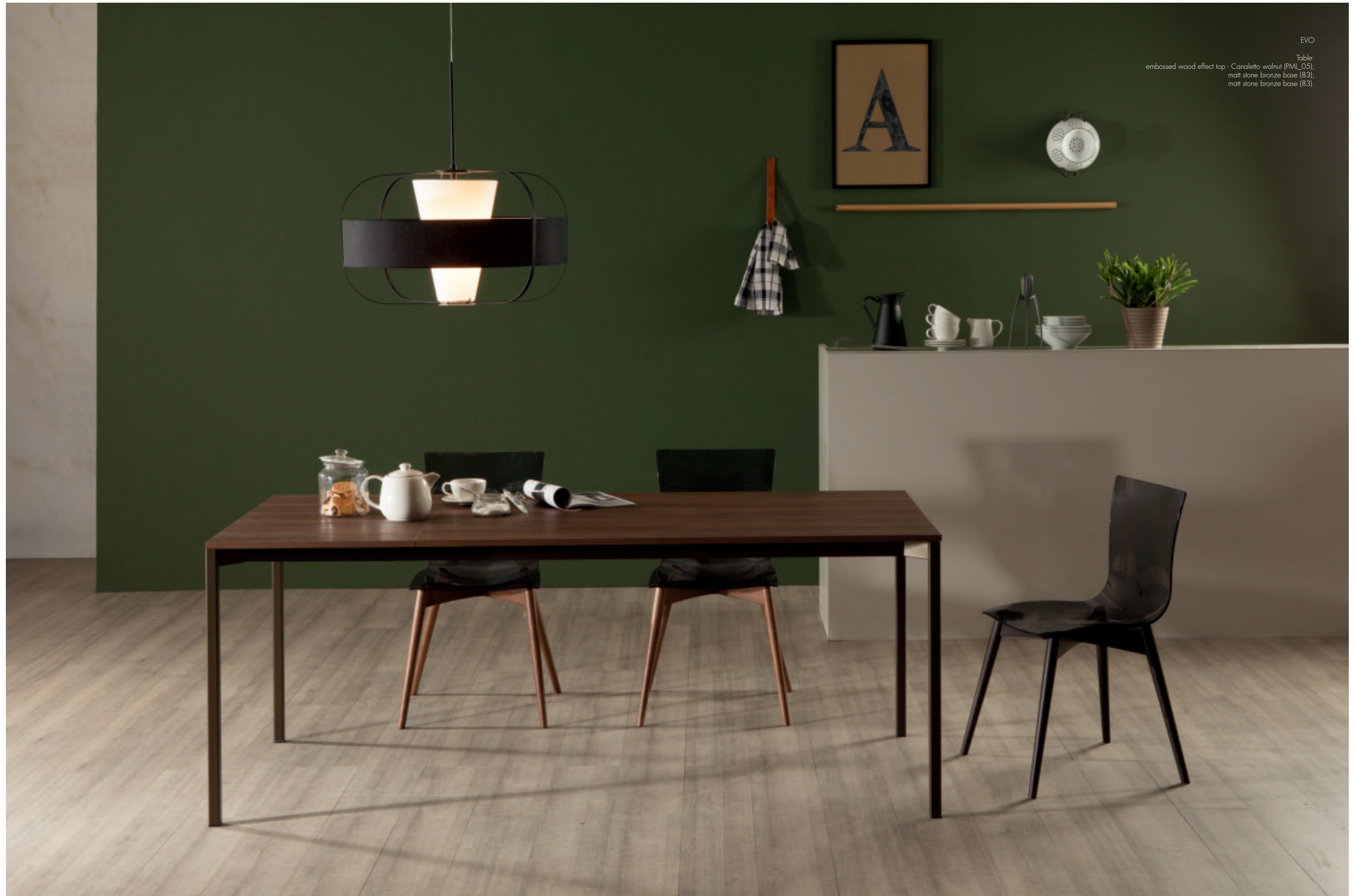
EVO Table: embossed wood effect top - Canaletto walnut (PML_05); matt stone bronze base (83); matt stone bronze base (83).