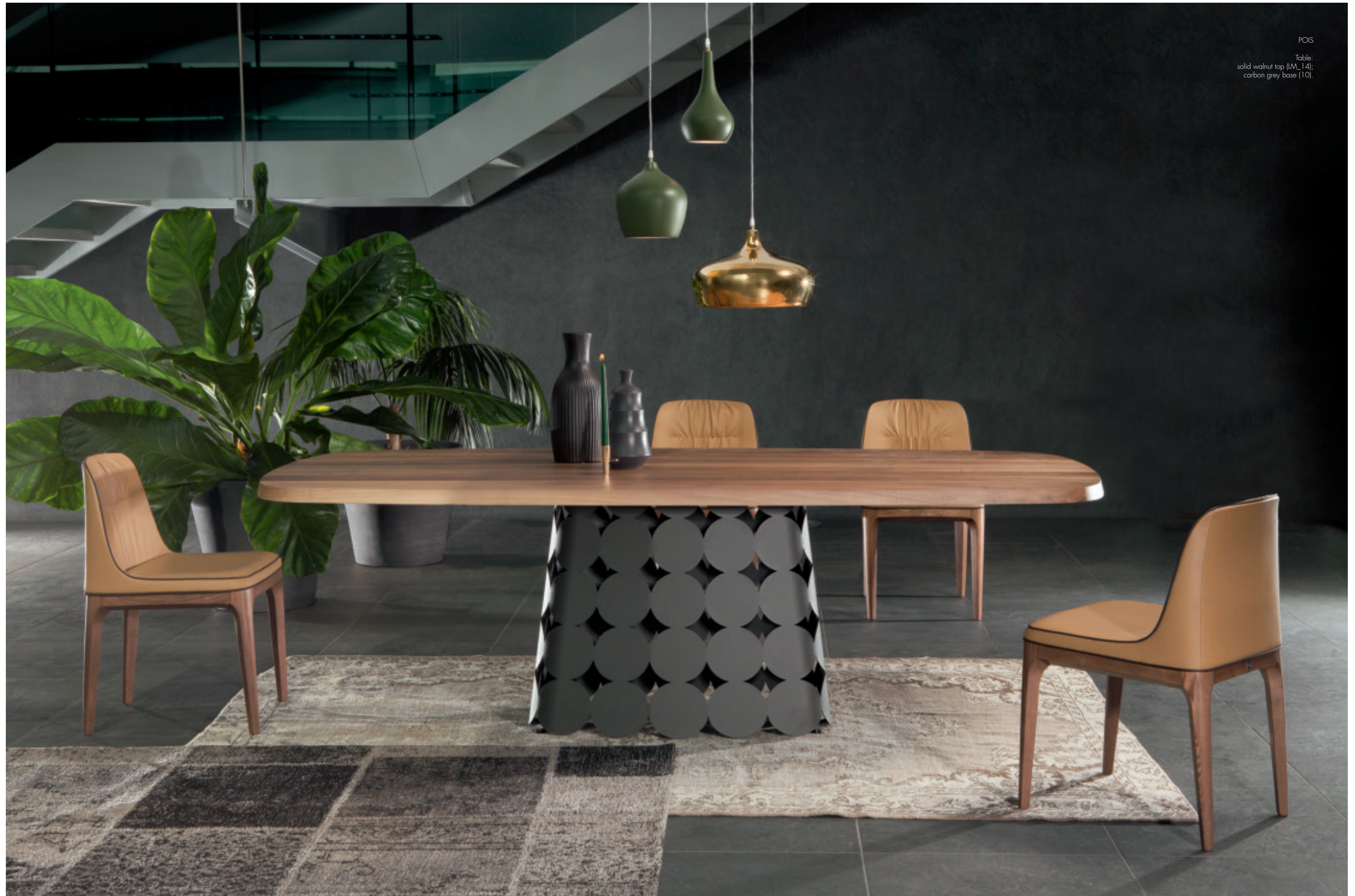
POIS Table: solid walnut top (LM_14); carbon grey base (10).