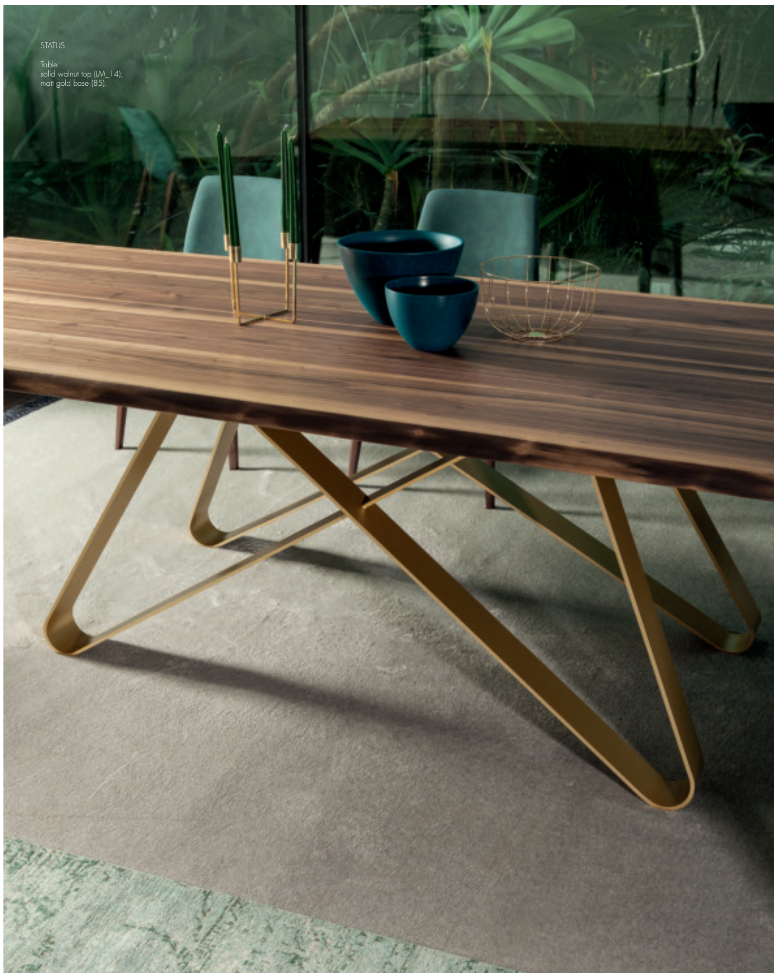
Table: solid walnut top (LM_14); matt gold base (85).

Linee e foglie, come una foresta contemporanea e tecnologica. Lines and leaves, like a contemporary, technological forest.