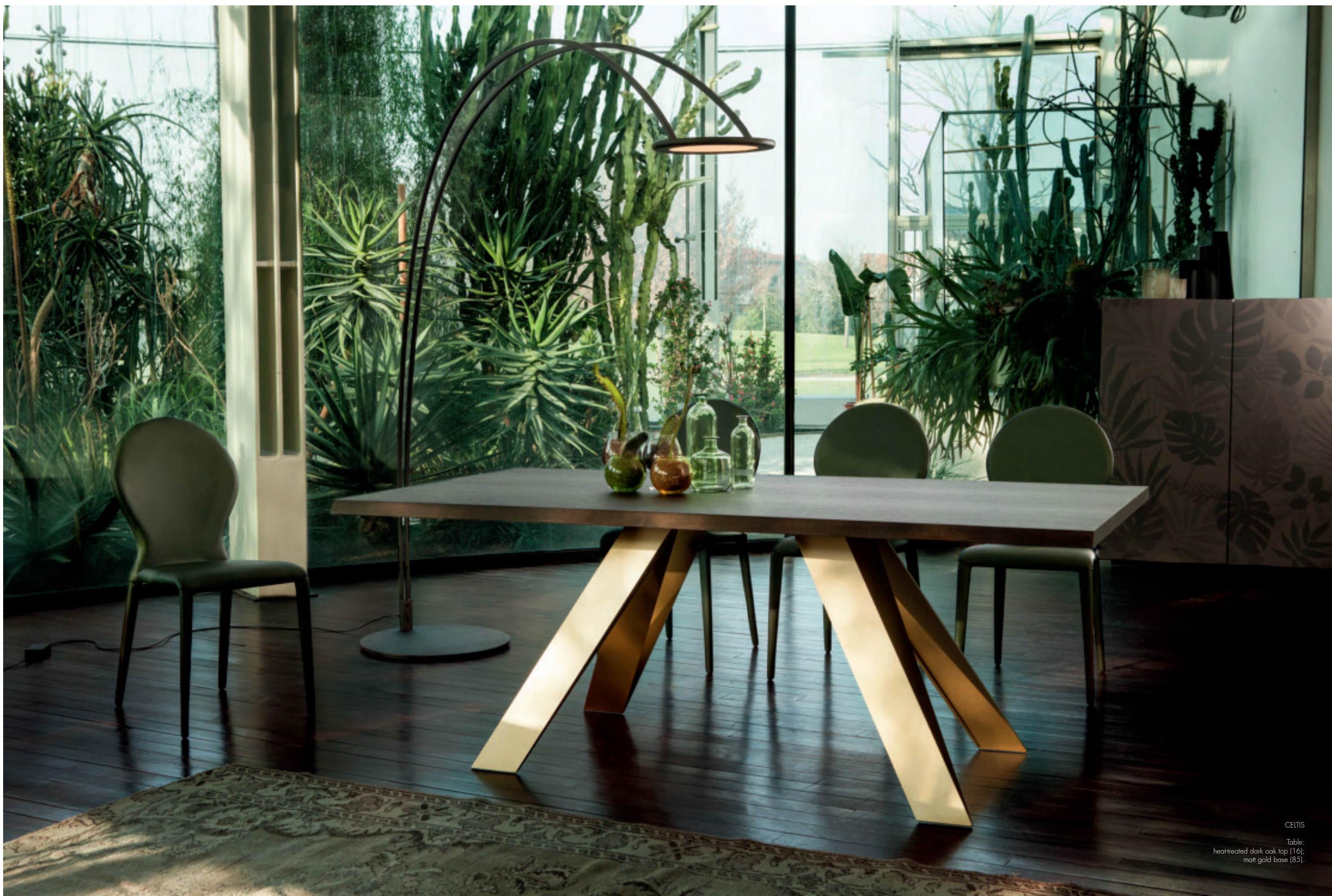
CELTIS Table: heat-treated dark oak top (116); matt gold base (85).