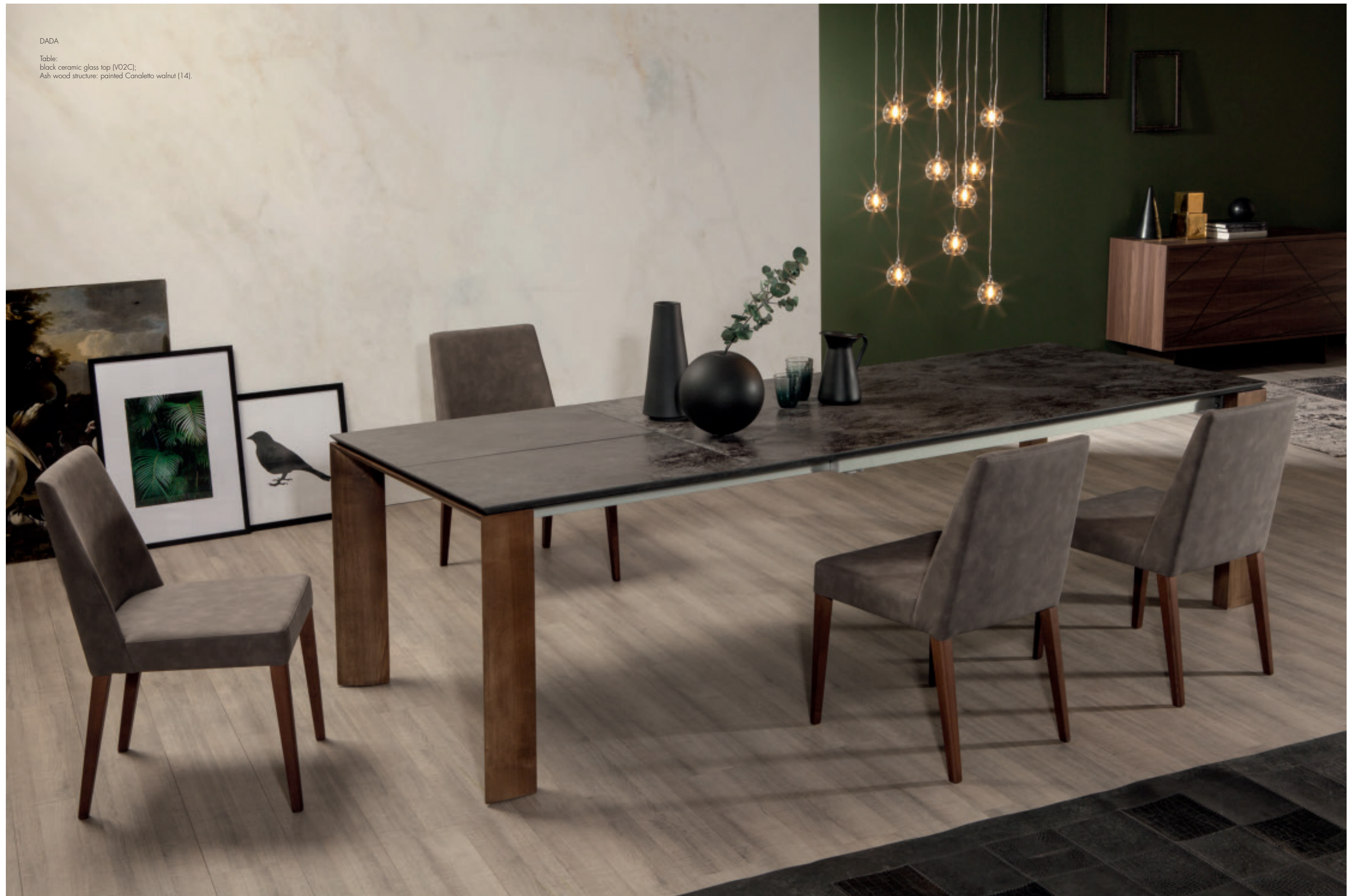
Table: black ceramic glass top (V02C); Ash wood structure: painted Canaletto walnut (14).